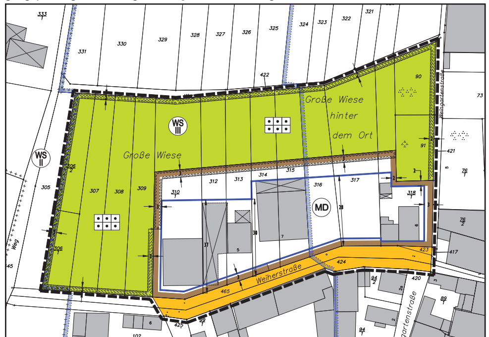
Bauleitplanung der Stadt Niddatal, Stadtteil Kaichen, Bebauungsplan K 10 „Große Wiese“ Hier: Räumlicher Geltungsbereich genordet, ohne Maßstab